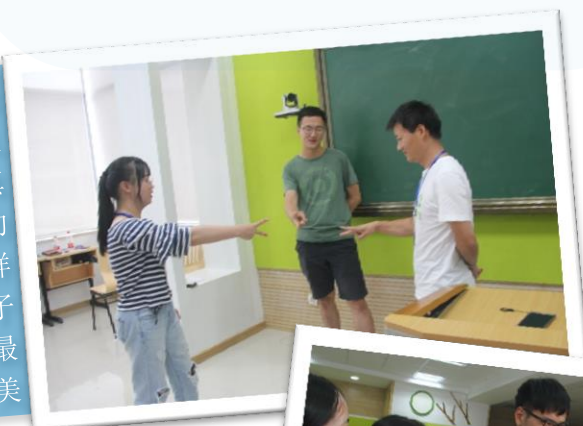
你认真的样子最美

挖掘课堂可能性，创设课堂体验，引导知识精细化加工，实现知识的建构和联结，进而帮助学生完成知识迁移，这是对教师的挑战也是机遇。